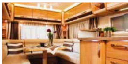
VEICOLI RICREAZIONALI RV/CAMPER/CARAVAN