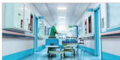
AMBIENTI SANITARI SANITARY AREAS